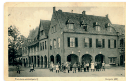
Ansicht van de winkelgalerij op 't Lansink in Hengelo.