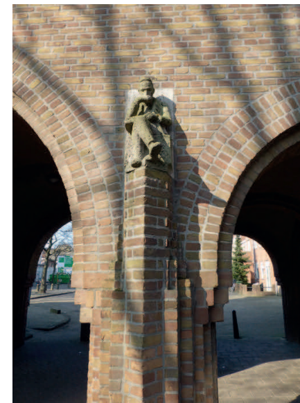
Tuindorp Heijplaat in Rotterdam.